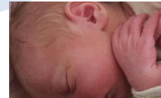
Hebammenvermittlung Brandenburg/Potsdam Private Gruppe - 906 Mitglieder

Gynäkologische Praxis MVZ Dahme-Spreewald in Lübben